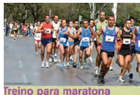
Treino para maratona

Uma lição para outros desportos, onde a participação única dá medalhas que potenciam reivindicações.